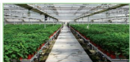
北京大汉 - 一品红、丽格海棠母本园