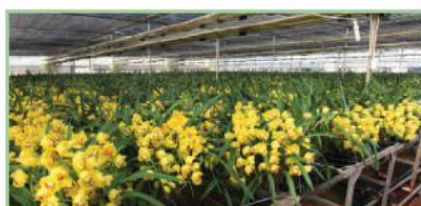
昆明大汉 - 石林农场