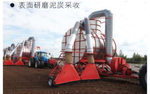
● 表面研磨泥炭采收